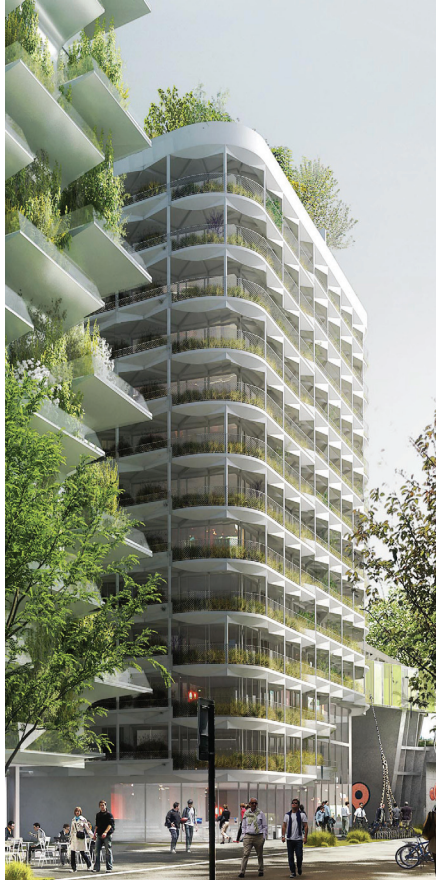
La Plant House (Potagers à tous les étages) dans le projet «In Vivo», à Paris 13 e , livraison 2020