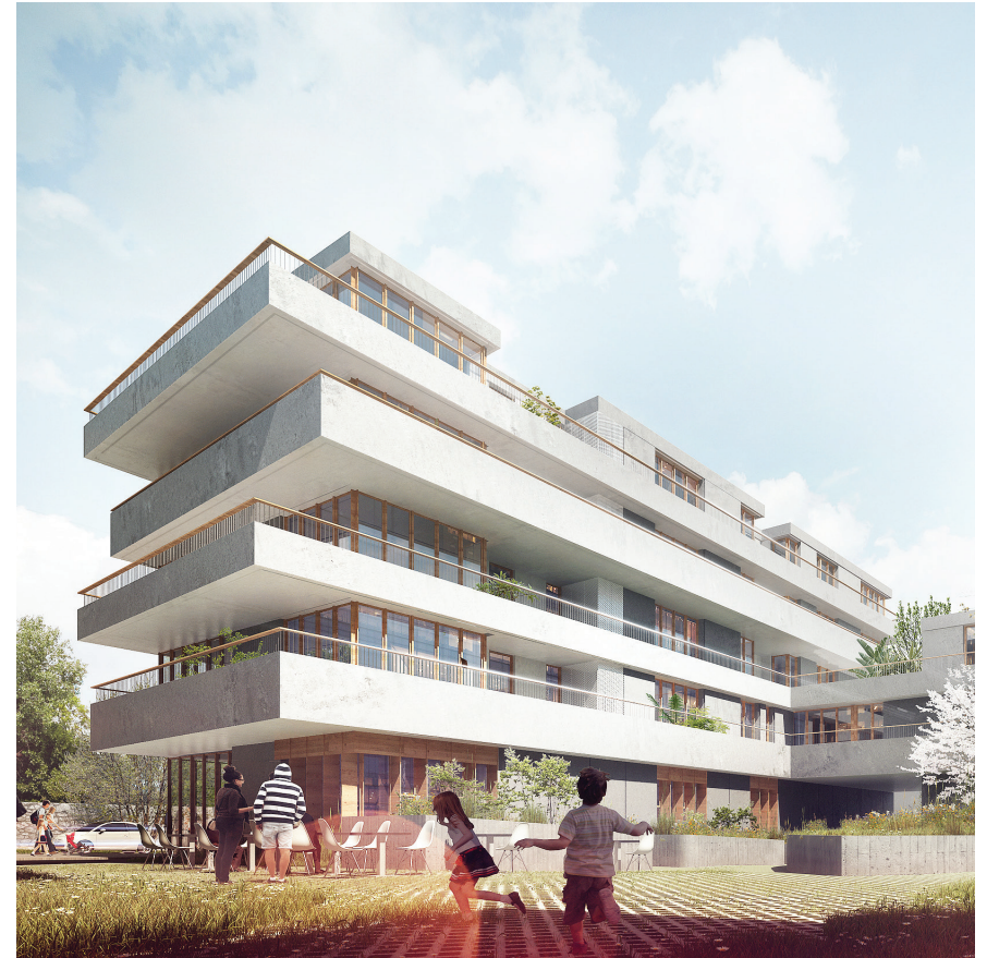
51 logements dans l'écoquartier Monconseil à Tours (Tours Habitat)