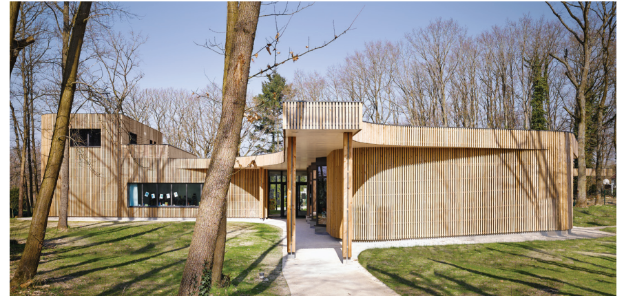
La Maison des Enfants à Briis-sous-Forges, livré en 2013