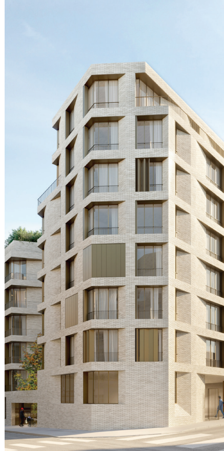
Un immeuble de 34 logements et 1 crèche pour la RIVP à Paris 16 e , livraison 2020