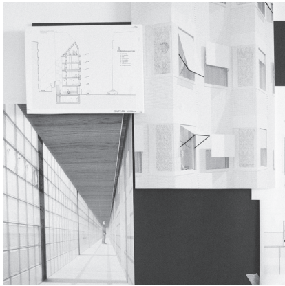
51 logements pour jeunes travailleurs à Paris 17 e