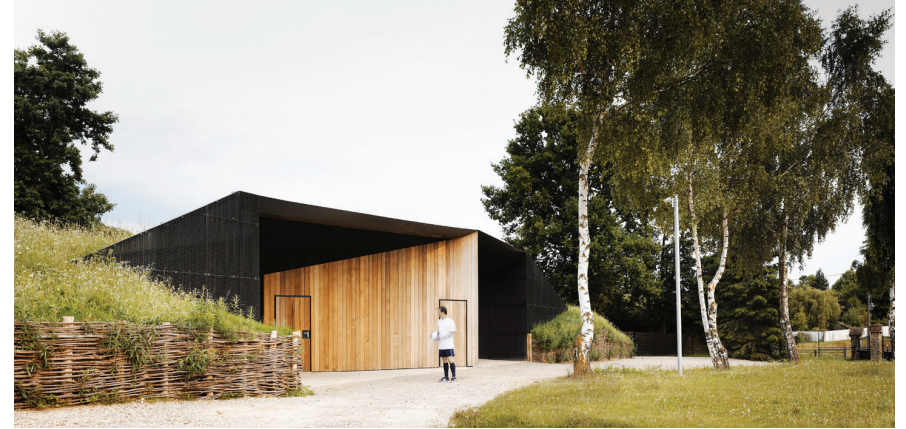
Pôle sportif de Forges-les-Bains, livré en 2013