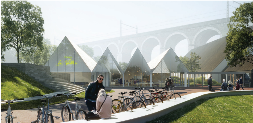
La médiathèque d'Épernon avec les archives municipales et une Agora d'exposition, livraison 2018